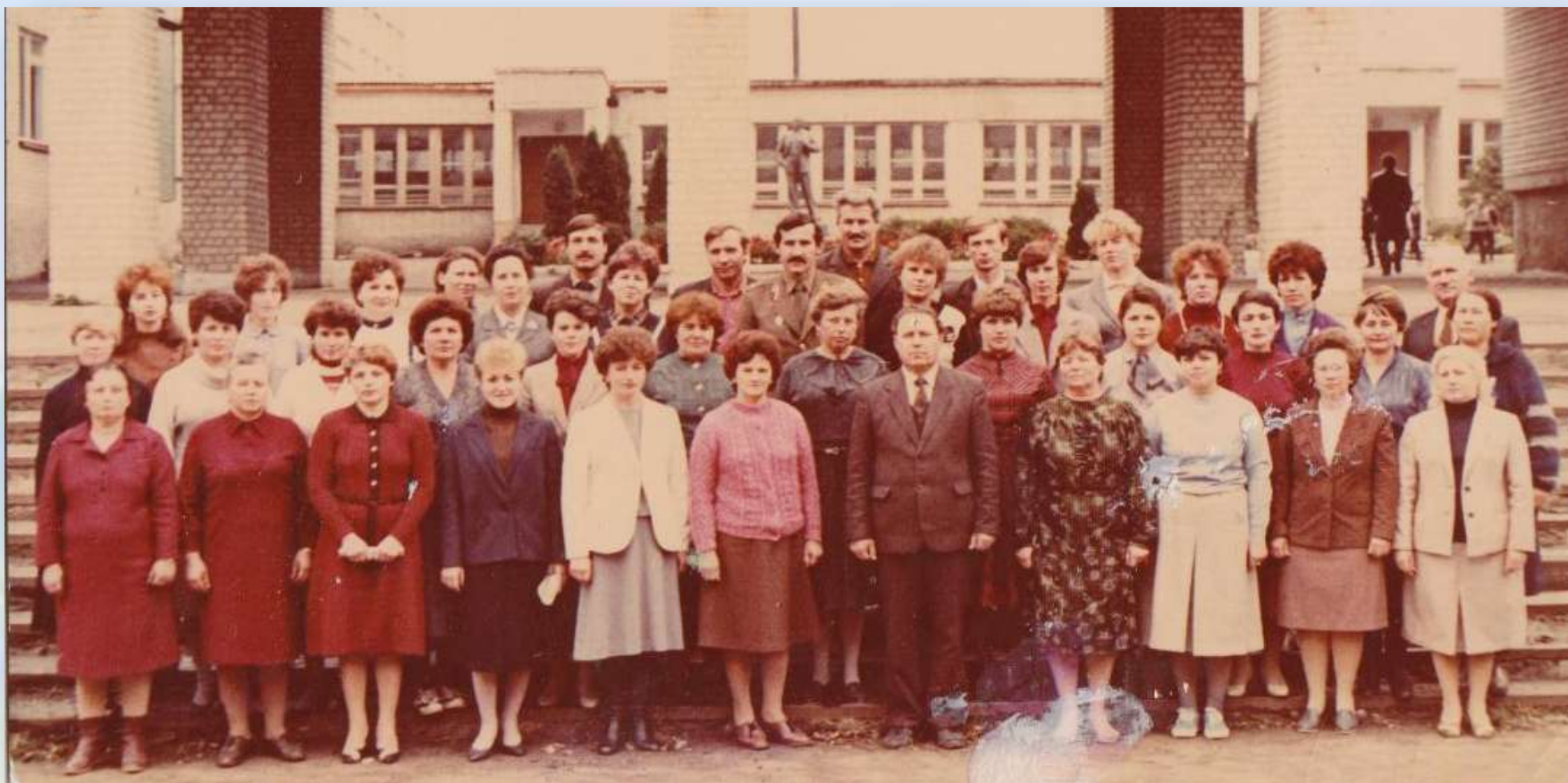
Педагогический коллектив школы

В середине 80-годов прошлого века библиотека обслуживала почти 1300 читателей, в школе было 54 комплекта классов.