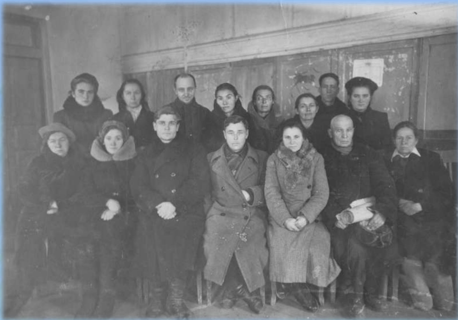
Педагогический коллектив 1947-48 учебный год