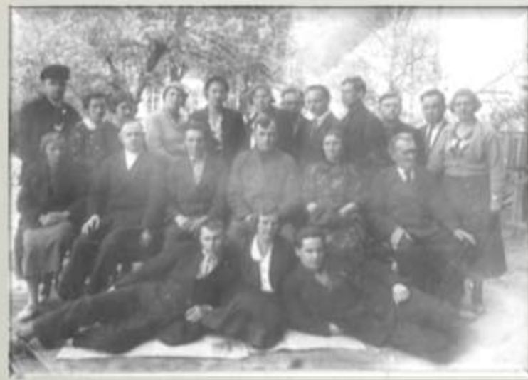
Коллектив учителей Буденовской школы 1938 г.

Перед войной в школе было 23 комплекта-класса, 900 человек учащихся. К этому времени в школе имелась богатая библиотека старинных и новейших изданий научной, учебной, популярной, публицистической, художественной литературы.