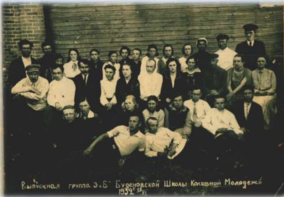
Выпускная группа 3 «Б» Буденовской Школы Колхозной Молодежи 1932 г.

Выпускная группа 3 «Б» класса Буденовской Школы Колхозной Молодежи 1932 г .