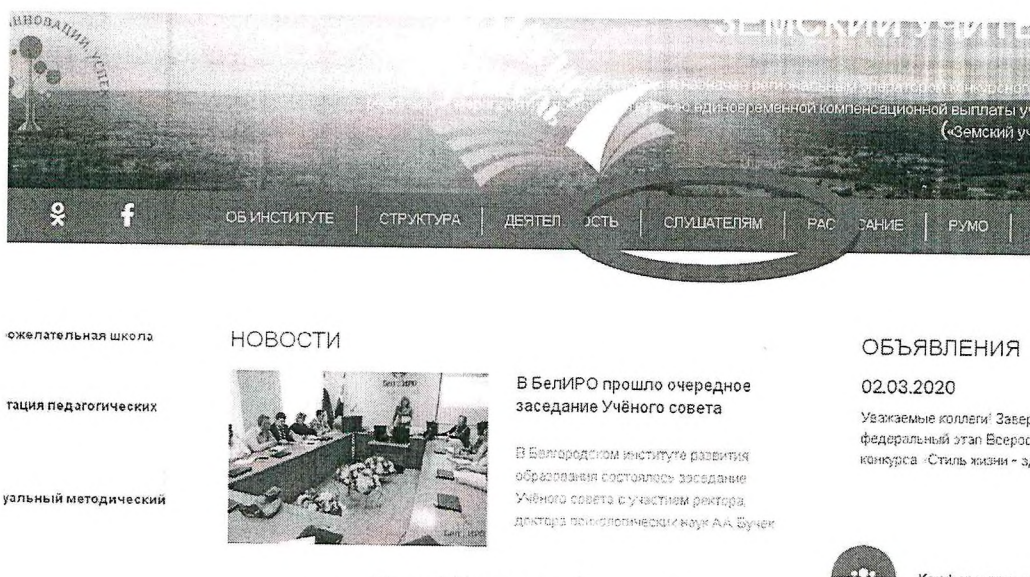
Рис.1 Раздел «Слушателям»