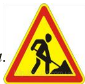
Знак «Дорожные работы»

Знак повесили с рассветом Чтобы каждый знал об этом. Здесь ремонт идёт дороги- Берегите свои ноги!