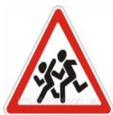
Знак «Осторожно дети!!!»

Я хочу спросить про знак, Нарисован он вот так: В треугольнике ребята Со всех ног бегут куда-то. Мой приятель говорит: «Это значит- путь открыт»