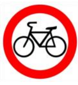
«Движение на велосипедах запрещено»

Велосипед на круге красном Значит, ехать здесь опасно!