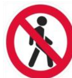
«Движение пешеходов запрещено»

Я в кругу с обводом красным, Значит ехать тут опасно. Тут, поймите запрещенье пешеходное движенье.