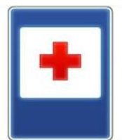
«Пункт медицинской помощи»

Если кто сломает ногу, Здесь врачи всегда помогут. Помощь первую окажут, Где лечиться дальше скажут